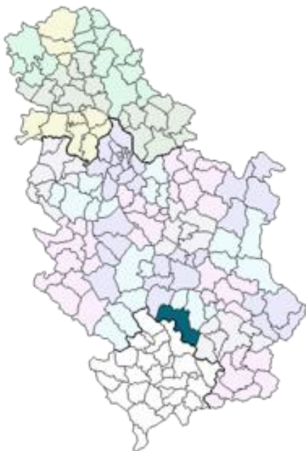
Слика бр.1. Положај општине Куршумлија у републици Србији

На територији Општине постоје три бање: Пролом, Луковска и Куршумлијска, као и јединствен геоморфолошки феномен, Ђавоља варош.